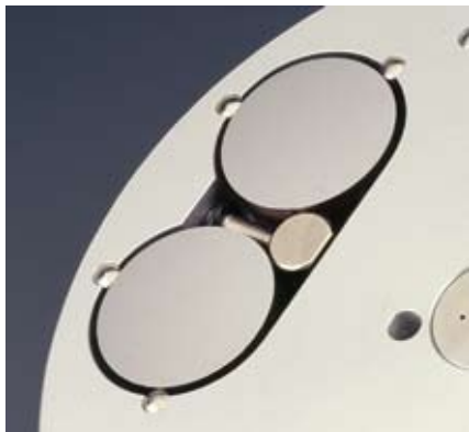
双夹紧功能—一个螺钉固定两个试样