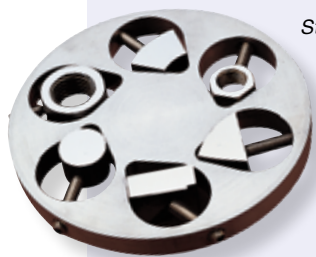
Struers试样夹具座可夹紧各种形状和尺寸的试样

带有矩形孔的试样夹具座可夹紧尺寸达70 x 53 mm的试样，而无需将试样切成小块。