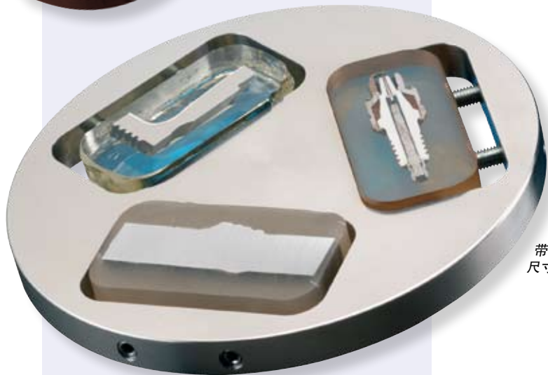
带有矩形孔的试样夹具座可夹紧尺寸达70 x 53 mm的试样